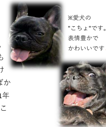
※愛犬の "こちょ"です。 表情豊かで かわいいです👉