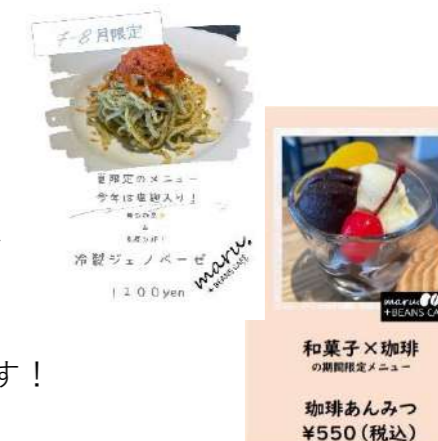
和菓子×珈琲 の期間限定メニュー 珈琲あんみつ ¥550(税込)

この季節にぴったりの冷たいパスタ、デザートとなっております！ 期間限定ですので是非この機会にお召し上がりください♪